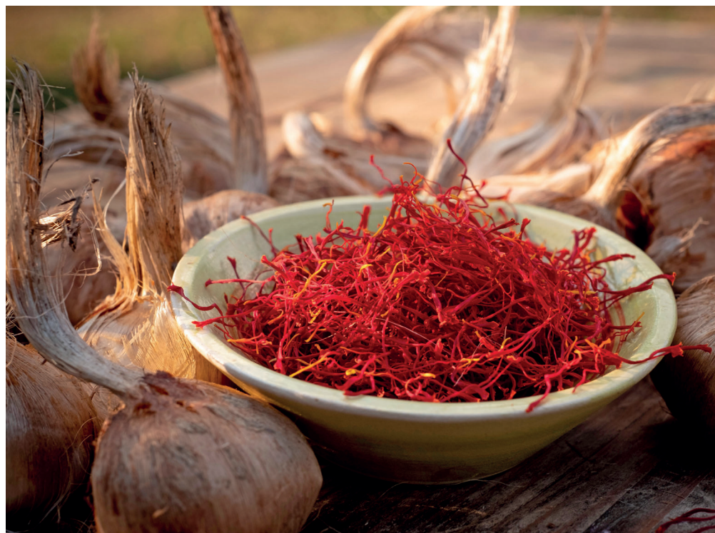
In Altenburg kann man im Herbst aus den selbst gepflückten Safran-Blüten die leuchtend roten Fäden zupfen und trocknen.

(DJD). Im Herbst verleiht die Safranblüte der ehemaligen Residenzstadt Altenburg in Thüringen ein sanftes lila Leuchten. Bei einer Kurzreise nach Altenburg haben wir das Geheimnis des Safran, auch rotes Gold genannt, ergründet - und durften seinen Reiz mit allen Sinnen erleben und genießen.