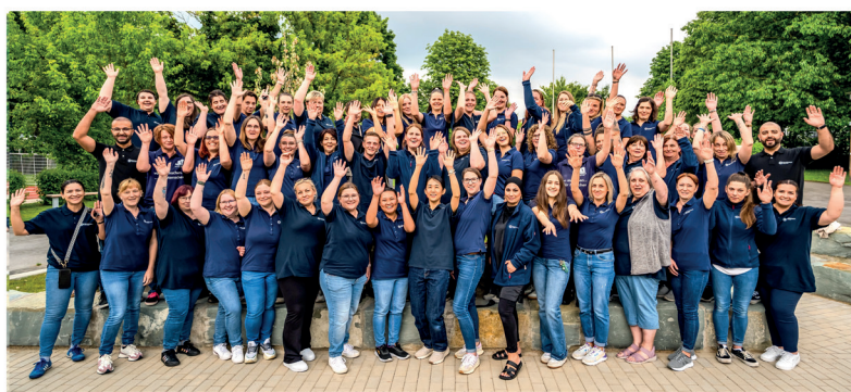
Das gesamte Team der Haushaltshilfe Hamm freut sich auf Ihren Anruf.

Erweiterung unseres bestehenden Unternehmens Die neue Anlaufstelle in Hamm ist keine Neugründung, sondern eine konsequente Erweiterung unseres etablierten Unternehmens. Unser Ziel ist es, künftig noch näher bei unseren Kundinnen und Kunden in Hamm zu sein und unsere bewährte Unterstützung weiter auszubauen. Als von der Stadt Hamm anerkannter Dienst verfügen wir über mehr als fünf Jahre Erfahrung in der alltäglichen Unterstützung und Zusammenarbeit mit