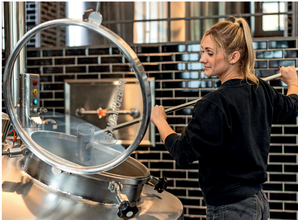
Die Kunst des Altbierbrauens wird in Düsseldorf gelebt.

(DJD). Bier zählt zu den beliebtesten alkoholischen Getränken deutscher Verbraucher. Nach Angaben des Deutschen Brauerbundes konsumieren sie jährlich rund 88 Liter der süßigen Erfrischung. In der Landeshauptstadt Nordrhein-Westfalens liegt dabei der Ursprung eines ganz besonderen Bieres: Schon lange bevor Craft Beer und Microbreweries ein weltweiter Trend wurden, haben Düsseldorfer Braumeister und Braumeisterinnen das Altbier mit seinem bitteren, herb-würzigen Aroma hergestellt. Heute ist die Düsseldorfer Altstadt das Herz einer Brautradition, die sich über Jahrhunderte hinweg entwickelt hat. In den Brauhäusern stehen Handwerk, Tradition und ausgereiftes Wissen über das Altbier im Fokus.