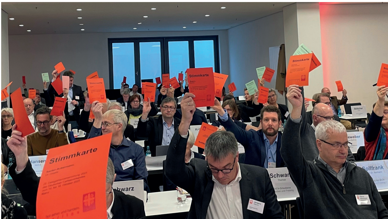
Die Bundesdelegiertenversammlung hat in Mainz den neuen Caritasrat gewählt.

einzubringen. Diese Wahl zeigt, dass die Caritas bereit ist, neue Wege zu gehen und die Vielfalt ihrer Trägerstrukturen stärker zu berücksichtigen. Gemeinsam mit den anderen Mitgliedern des Caritasrates freue ich mich, die Zukunft unseres Verbandes aktiv mitzugestalten.“