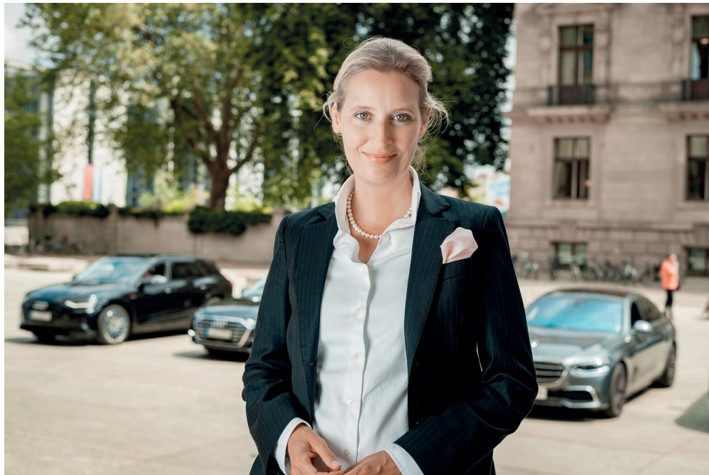
Alice Weidel, MdB

Dass ein Drittel der befragten deutschen Manager angeben, die Produktion ihrer Unternehmen aktiv in andere Kontinente zu verlagern