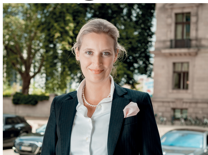
Alice Weidel, MdB

Mittelstand von einer beispiellosen Pleitewelle überrollt wird. Der Versuch, Klimaneutralität über Wettbewerbsfähigkeit zu stellen, führt zwangsläufig in Rezession, Arbeitsplatzabbau und flächendeckende Deindustrialisierung. Wer ernsthaft will, dass Stahl ‚Made in Germany‘ Zukunft hat, muss endlich Schluss machen mit der planwirtschaftlichen Energie- und Subventionspolitik. Nur die AfD steht für eine Industriepolitik, die auf günstige Energie, technologische Freiheit und marktwirtschaftliche Vernunft setzt – damit Deutschland wieder produziert, statt sich selbst abzuwickeln.“