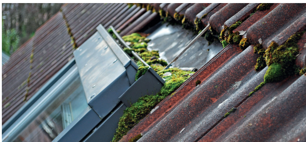
Moos und Laub können die Wasserabläufe rund ums Dachfenster verstopfen, sodass Regenwasser nicht mehr richtig abfließt. Es sucht sich dann seinen Weg ins Innere, was nicht nur unschöne Flecken an der Wand zur Folge haben kann. Schlimmstenfalls weicht die Dämmung auf, es droht ein erheblicher Schaden an der Bausubstanz.

Überprüfung aller Funktionen Die Experten von TLS-Dachfenster etwa überprüfen bei jedem Wartungsauftrag alle Funktionen des Dachfensters, schmieren sämtliche mechanischen Elemente und prüfen die Federspannung der Fensterflügel. Bei Bedarf stellen sie die Federn so nach, dass der meist schwere Flügel in jeder Position stehen bleibt. Zudem reinigen sie die Wasserabläufe rings um das Dachfenster von außen und entfernen Verschmutzungen wie Blätter oder Moos. Bemerkten die Fachleute Schäden oder Verschleiß am Dachfenster oder am Zubehör, zum Beispiel am Außenrollladen, dokumentieren sie dies und veranlassen einen