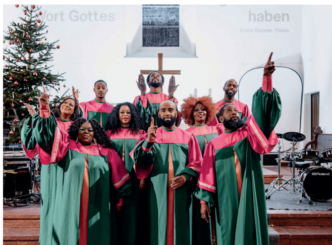
New York Gospel Singers 2025

Seit fast zwei Jahrzehnten gastieren die New York Gospel Stars hierzulande und füllen Kirchen und Sälevon Hamburg