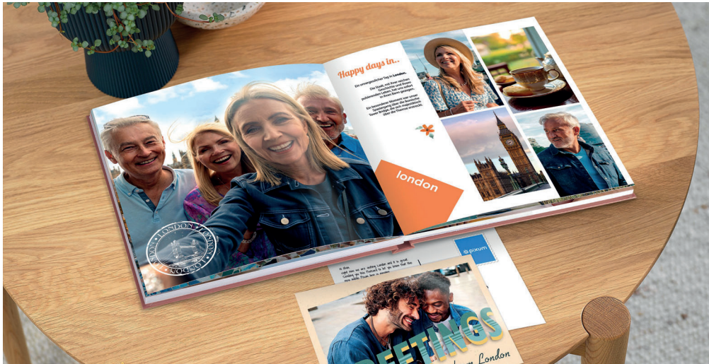
Fotos, die Geschichten erzählen: Mit etwas Kreativität zaubert man aus Schnappschüssen individuelle Präsente.

(DJD). Geschenke mit persönlichem Charakter: Mit etwas Kreativität lassen sich Fotos in individuelle Präsente verwandeln. Ein Fotobuch etwa bewahrt gemeinsame Erlebnisse und lädt immer wieder zum Blättern ein. Ob verschneite Landschaften, festliche Abende mit der Familie oder der Sommerurlaub am Meer – die schönsten Momente werden zu einem liebevoll gestalteten Jahresrückblick zusammengefügt. Auch Fotokalender, hochwertig gedruckte Wandbilder oder kleine Aufmerksamkeiten wie eine originell gestaltete Tasche sind schöne Unikate. Mit der kostenlosen Software zum Download unter www.pixum.de lassen sich Fotos bequem am Computer zu individuellen Designs zusammenstellen. Wer lieber spontan kreativ wird, nutzt beispielsweise die Pixum App für Android und iOS.