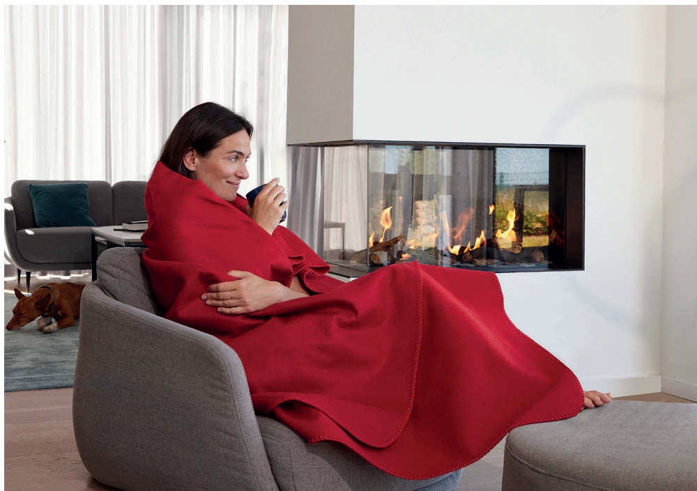
Kuscheln am Kamin: In der kalten Jahreszeit machen wir es uns gerne mit Feuer gemütlich. Dabei sollte Sicherheit großgeschrieben werden.

Fox. Sie können kuschelig wärmen, kleine Brände löschen und Menschen vor Feuer und Funken schützen – mehr unter www.ask-the-fox.com . Die hypoallergen und antimikrobiellen Decken gibt es auch mit Kapuze, für Babys, Haustiere und mit personalisierter Stickerei.